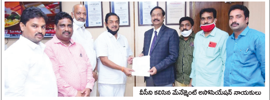
వీసీని కలిసిన మేనేజ్మెంట్ అసోసియేషన్ నాయకులు