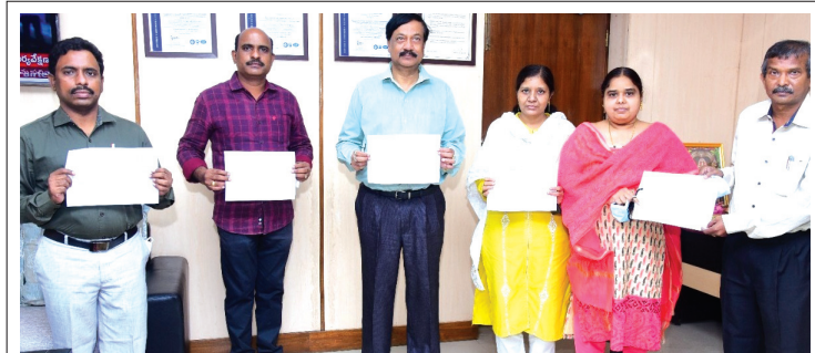
రైటప్:- పరీక్ష ఫలితాలు విడుదల చేస్తున్న వీసీ