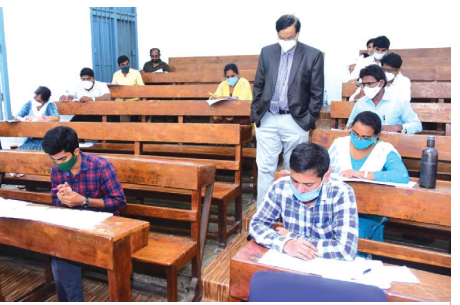
వీసీ సెట్ పరీక్షలను పరిశీలిస్తున్న వీసీ