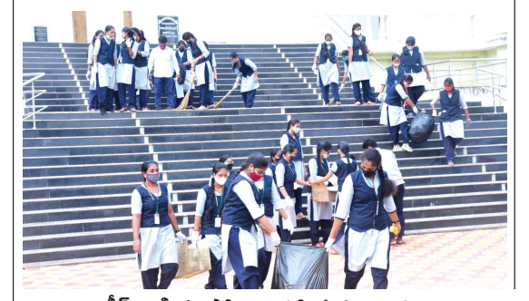
క్లీన్ ఇండియా ప్రోగ్రాం నిర్వహిస్తున్న విద్యార్థులు