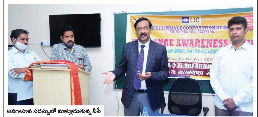
అవగాహన సదస్సులో మాట్లాడుతున్న వీసీ

29.10.21 (మీడియాసెల్) సామాజిక బాధ్యతగా ఎల్.ఐ.సి. నిర్వహిస్తున్న కార్యక్రమాలు అభినందనీయమని వీసీ ఆచార్య మొక్కా జగన్నాథరావు అన్నారు. ఆదికవి నన్నయ యూనివర్సిటీ సహకారంతో భారతీయ జీవిత బీమా సంస్థ విజిలెన్స్ అవేర్నెస్ వీక్ని నిర్వహిస్తుంది. “స్వతంత్ర భారతదేశం ఏ75: సమగ్రతతో స్వయం రిలయన్స్” అనే థీమ్తో విజిలెన్స్ ప్రాముఖ్యతపై అవగాహన కల్పిస్తుంది. యూనివర్సిటీలో నిర్వహిస్తున్న అవగాహన కార్యక్రమాన్ని వీసీ జగన్నాథరావు శుక్రవారం పరిశీలించారు. ఈ సందర్భంగా వీసీ మాట్లాడుతూ భారత దేశ ప్రజలకు అత్యంత నమ్మకమైన సంస్థ ఎల్.ఐ.సి. గుర్తింపు పొందిందని అన్నారు. ఎల్ఐసీ ఎంతో సామాజిక బాధ్యతగా వ్యవహరిస్తూ నిర్వహించే కార్యక్రమాలు అభినందనీయమని తెలిపారు. ఇటువంటి అవగాహన కార్యక్రమాల్లో పాల్గొనడం ద్వారా విద్యార్థులకు సృజనాత్మకమైన అంశాలు తెలుస్తాయన్నారు. దేశం పట్ల, సమాజం పట్ల బాధ్యతాయుతంగా వ్యవహరించడం అలవాటు అవుతుందన్నారు. వేగంగా అభివృద్ధి చెందుతున్న భారతదేశ ఆర్థిక వ్యవస్థలో విజిలెన్స్